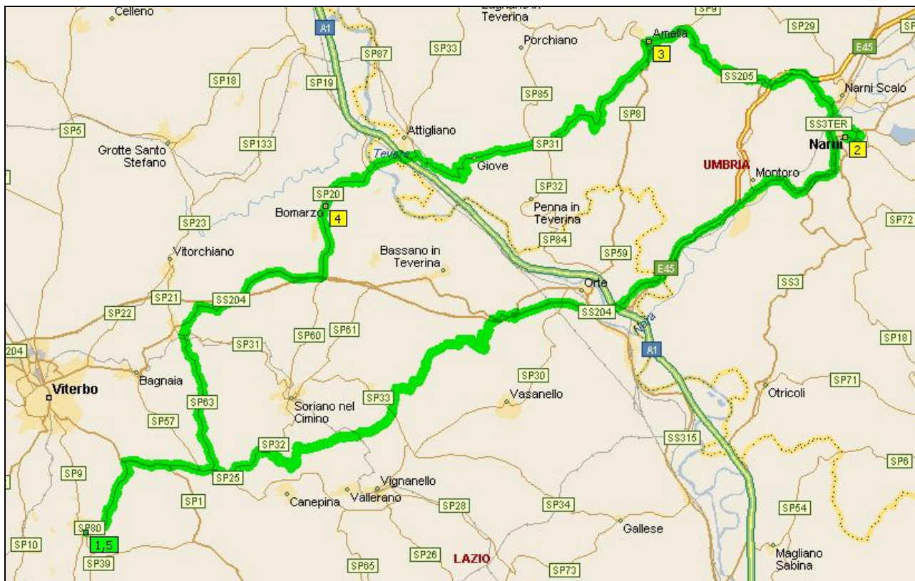
Narni, Amelia, Bomarzo – KM 115