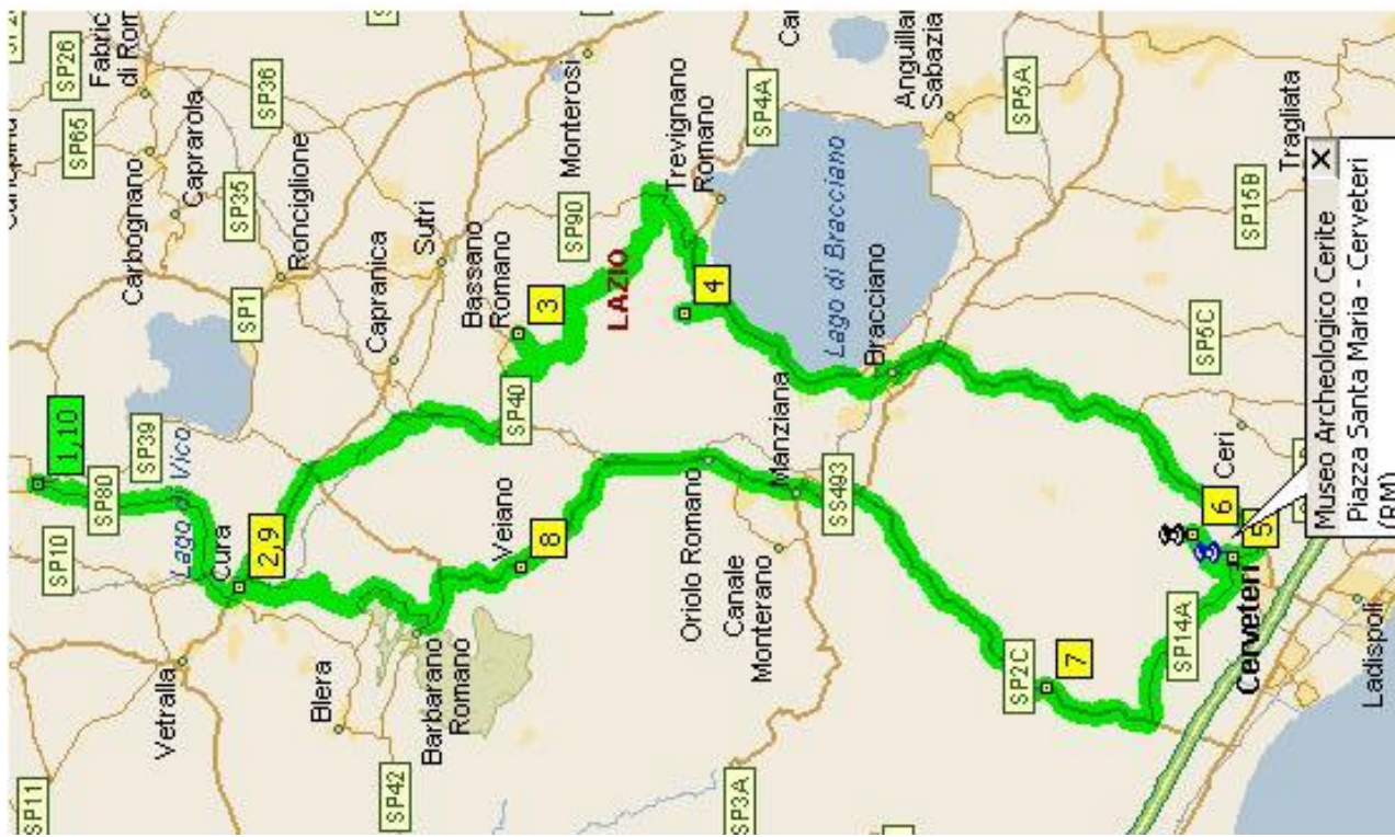
Necropoli etrusca e Museo archeologico di Cerveteri – Km 138